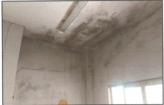
FIGURA 02 - Trincas e manchas nas paredes