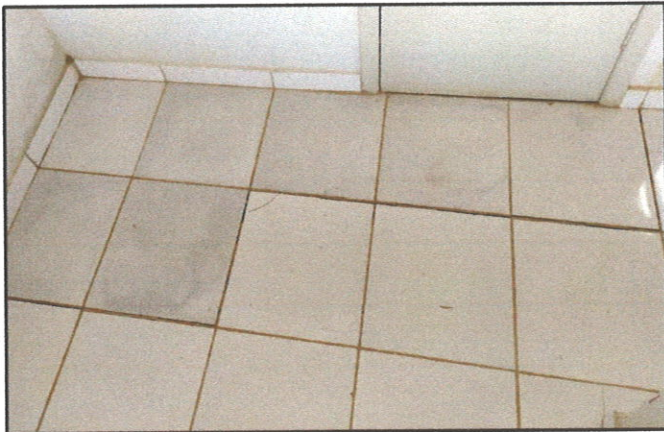
FIGURA 03 - Revestimento cerâmico danificado