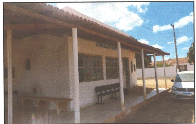
FIGURA 06 - Pintura externa danificada