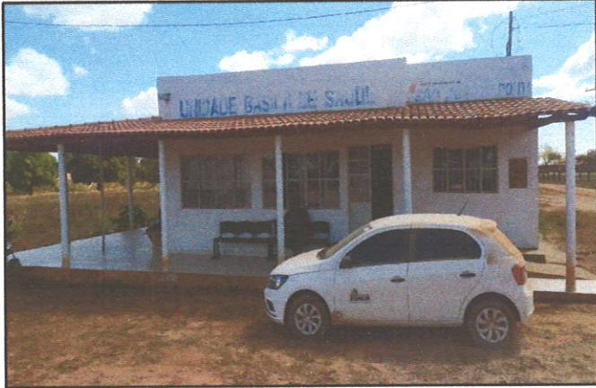
FIGURA 01 - Fachada UBS

UBS: Unidade Básica de Saúde Dinizlândia Localização: Dinizlândia - São João da Ponte/MG Ordem de Serviço: 008/2022 - Prefeitura Municipal de São João da Ponte Data: 21/07/2022