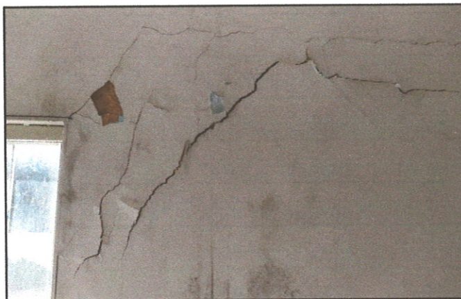
FIGURA 05 - Pintura danificada