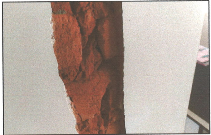
FIGURA 04 - Reboco danificado